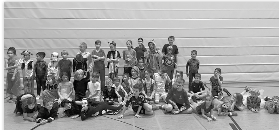
Fasching bei den Leichtathleten